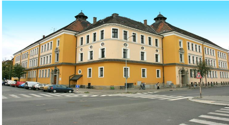
Obr.1 – Budova školy AGYS